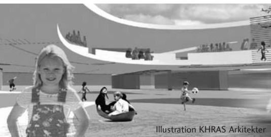
Illustration KHRAS Arkitekter