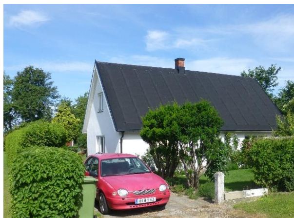
Foto från 2019. Huset sett från gatan. Växterna på tomten är de samma som på bilden där huset är klätt med Eternit