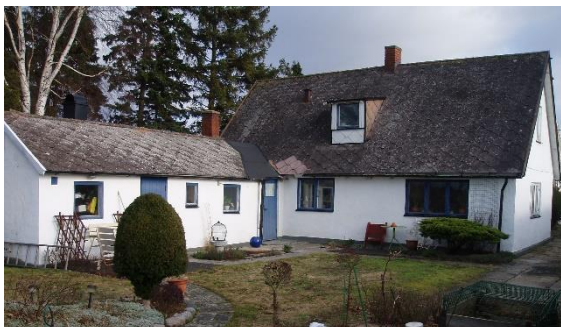
Foto från 2011 före byte av tak, ny vindskåpa och rivning av skorsten på brygghuset